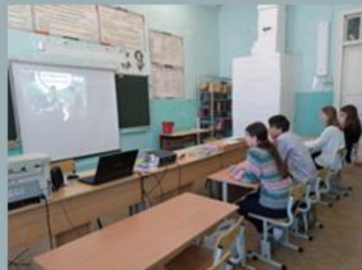
«Что заставляет человека брать взятки?», 8 кл.