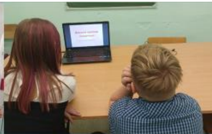
«Тайна слова «коррупция», 5 кл.