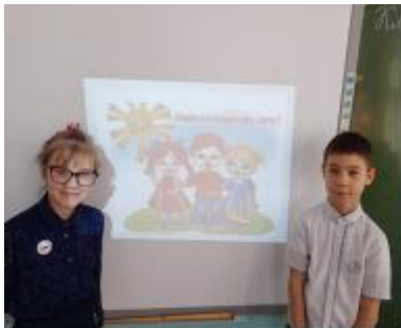
Классный час «Мои права», 2 кл.