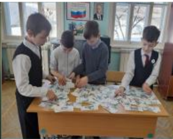
Классный час «Деньги «чужие» и «свои», 3 – 4 кл.