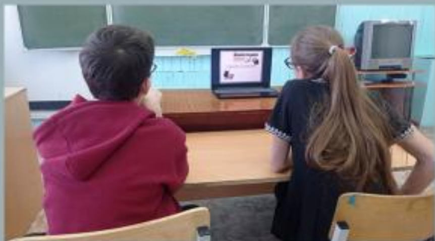
«Коррупция. Твоё НЕТ имеет значение», 6 кл.